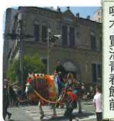
もりおか 啄木實治青春館前