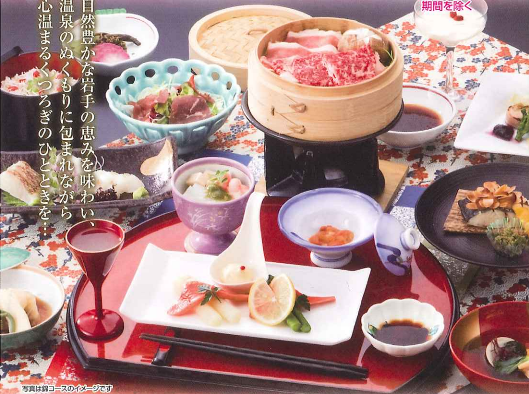
写真は錦コースのイメージです