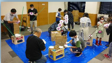
山車に装飾する「小桜」製作の体験

「火消組と山車展」は、9日間で入場者数1,300人。(令和2年9月、ギャラリーおでつて)