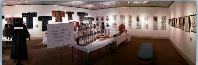
「火消組と山車展」(ギャラリーおでつて)