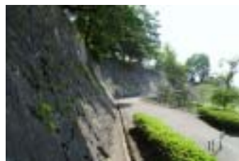
盛岡城址 (岩手公園)