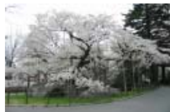
石割桜 (盛岡地方裁判所)