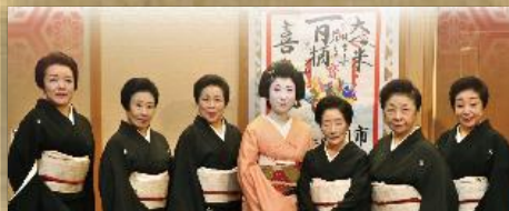
盛岡芸妓、勢ぞろい