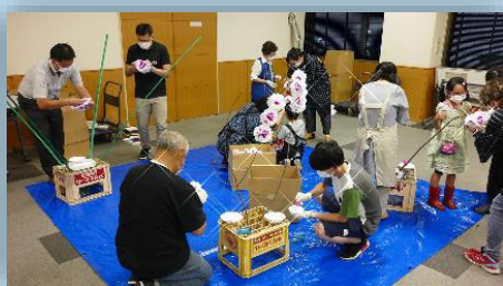
山車に装飾する「小桜」製作の体験

「火消組と山車展」は、9日間で入場者数1,300人。(令和2年9月、ギャラリーおでつて)