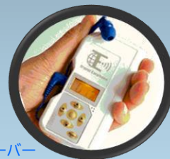
ガイドレシーバー

市民観光ガイドがお客様と安全な社会的距離を保ちつつガイドツアーを実施できる音声明瞭なガイドレシーバー330台を導入。新型コロナウイルス感染予防に対応した新しい安全安心なツアーの形にいち早く対応しました。令和2年度の利用延べ台数379台。