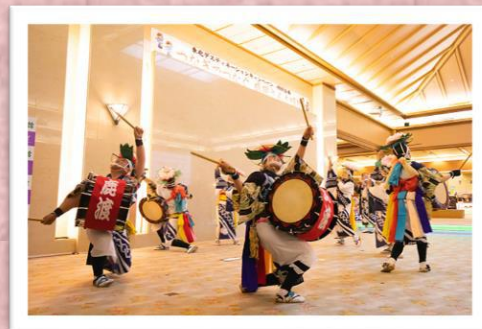
東北DC「つなぎでつなぐ、さんさ踊り」