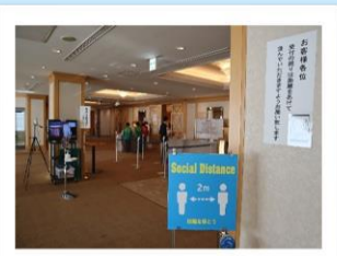
令和2年度「岩手・もりおかコンベンションフェア」