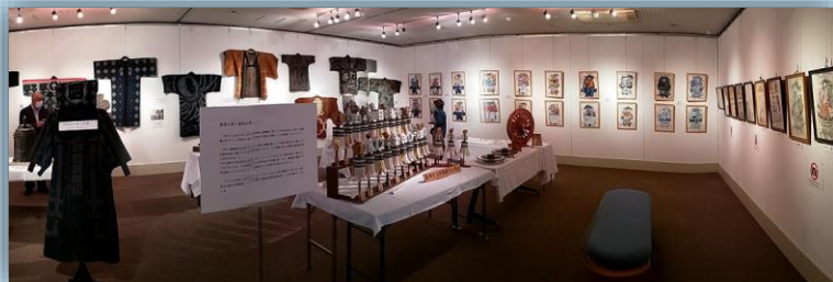
「火消組と山車展」(ギャラリーおでつて)